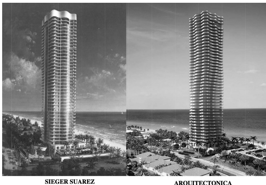
Figura 3.