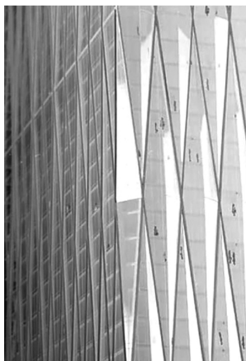
Figura 2. Detalle de la Freedom Tower de Childs.

Esta tesis del «observador promedio» sostenida en Oravec fue desestimada posteriormente en otro caso que se presentó en ese mismo país ( Sieger Suarez Architectural Partnership, Inc. v. Arquitectonica International Corp ) 38 porque, en opinión del juez, «ya que